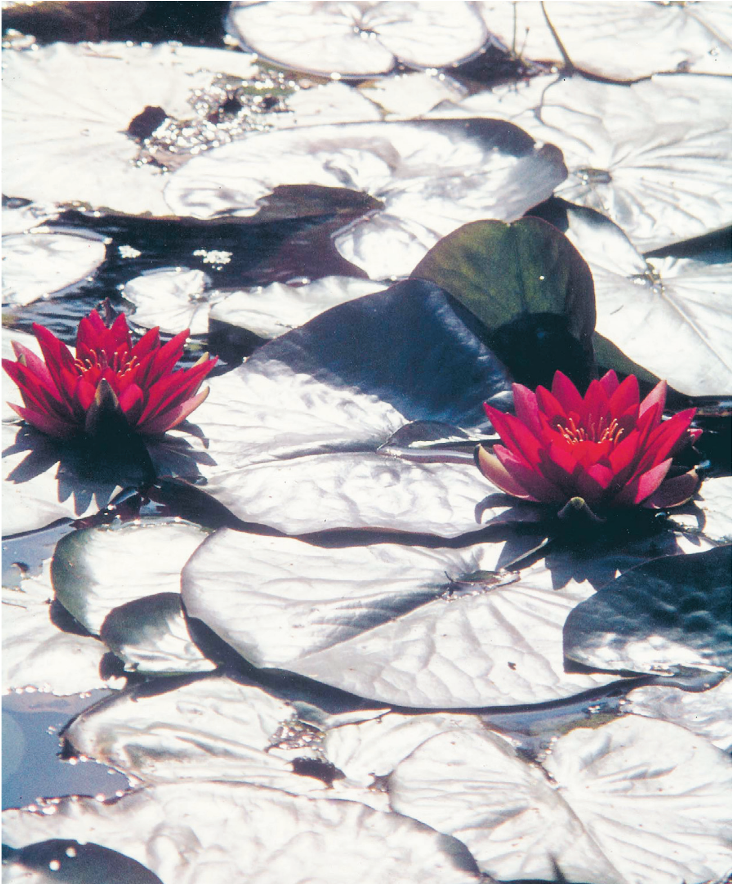
Tyske hobbyfotografen Christoffer Kerkovius förevigar Vänerns och den svenska landsbygdens skönhet på bild.