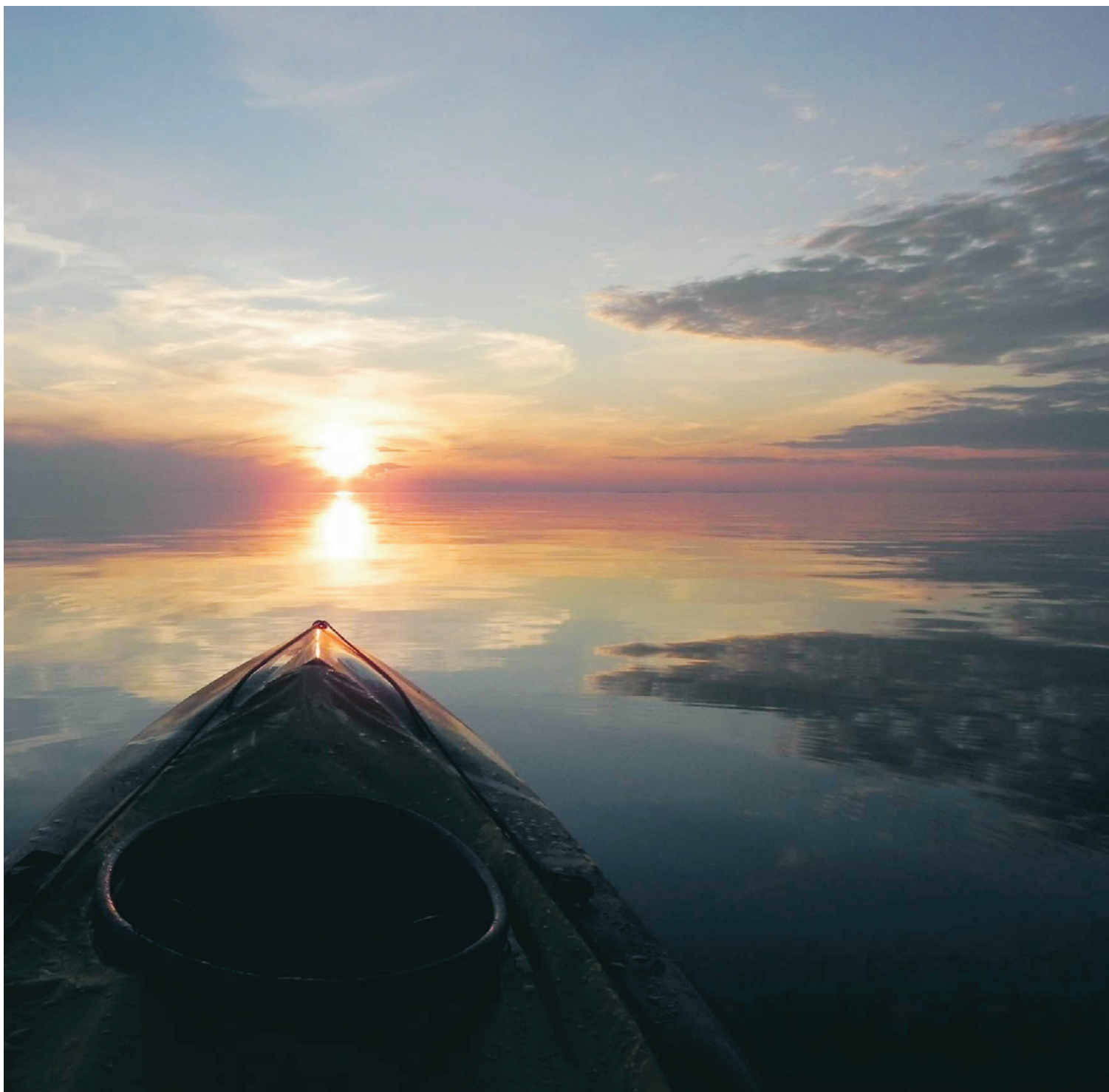
ute på Vänern, oftast med kameran i högsta hugg. Denna bild är tagen 2010, strax utanför Baggerud.